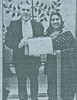
ভিত্তি করে এই রিপোর্ট তৈরি হয়েছে। এই বছর ৯৫০টিরও

কর্মস্থলের মান নির্ধারণের জন্য এটিই ভারতের বৃহত্তম বার্ষিক সমীক্ষা। কর্মচারীদের গোপন জ্ঞানবন্দি এবং সংস্থার ব্যবস্থাপনা এবং পরিচালনা নিরীক্ষণের উপর